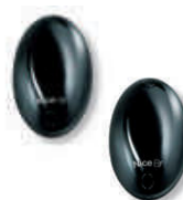
BF fotokomórka (para) zasięg 15-30m