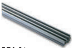
SPA 21 przedłużenie szyny 1 m z łańcuchem i spinką do SPIDO/SP6100