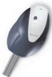
SP6000 siłownik 24V z wbudowaną centralą sterującą