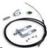
SPA 2 zestaw wysprężlania z zewnątrz do SPIDO/SP6100