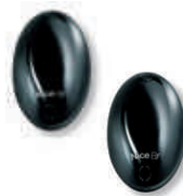
BF fotokomórka (para) zasięg 15-30m