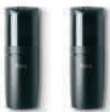
FT210 fotokomórki (para-bez baterii) nastawne z kątem 210°, zasięg 15 m