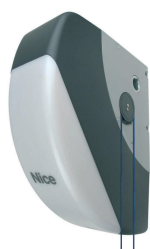
SOON siłownik 24V z wbudowaną centralą sterującą BLUEBUS